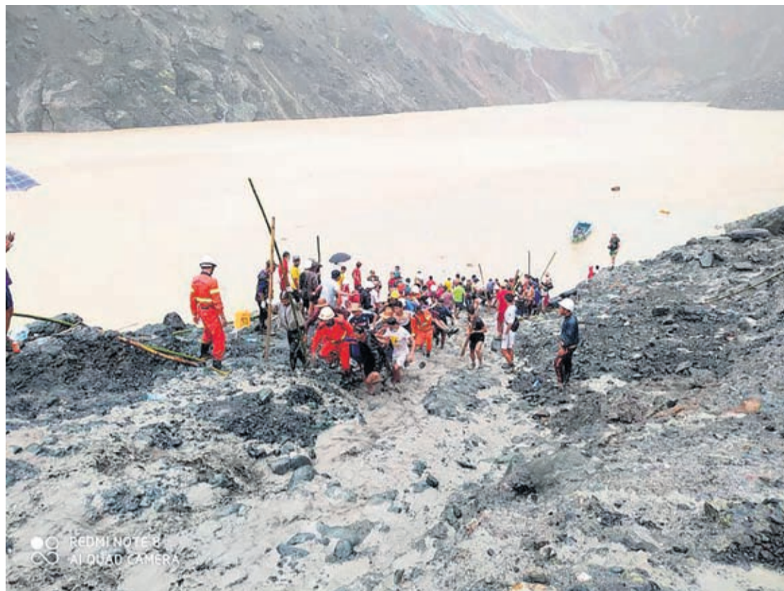
In this photo released from Myanmar Fire Service Department, rescuers carry a recovered body of a victim in a landslide from a jade mining area in Hpakant, Kachin state, northern Myanmar Thursday, July 2, 2020.

Those taking part in the recovery operations, which were suspended after dark,